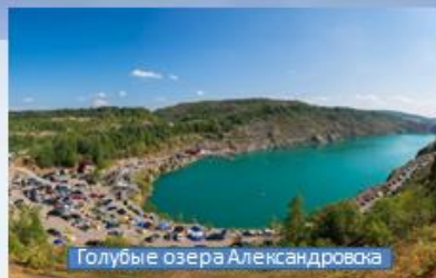
Голубые озера Александровска