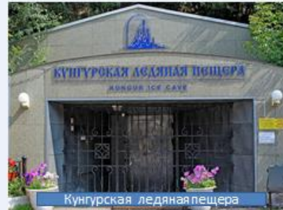
Кунгурская ледяная пещера