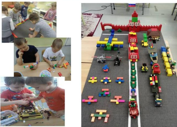
Приложение к НОД «Парад Победы»

Оборудование: проектор, ноутбук, презентация «Игры с пароводиком», игрушка пароводик, картинки: паровод, машина, паровоз; зеркало, изображение буквы Л, карточки с буквами, карточки с недописанными буквами Л; изображение 3 островов, со схемами «места звука в слове», изображения пароводов с предметами в названии которых звук Л находится в начале, в середине, в конце слова.