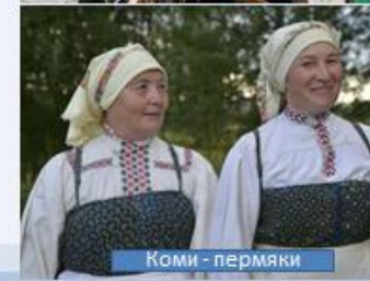
Коми - пермяки