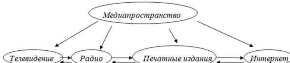
Рис.1. Взаимодействие элементов медиапространства.

Медиапространство - это электронное окружение, в котором отдельные люди или их группы и другие сообщества могут действовать вместе в одно и то же время. В этом пространстве они могут создавать визуальную и звуковую среду, воздействующую на реальное пространство. В нём они могут, соответственно, производить и контролировать запись и воспроизведение изображения и звука, а также доступ к ним [1]. (рис.1)